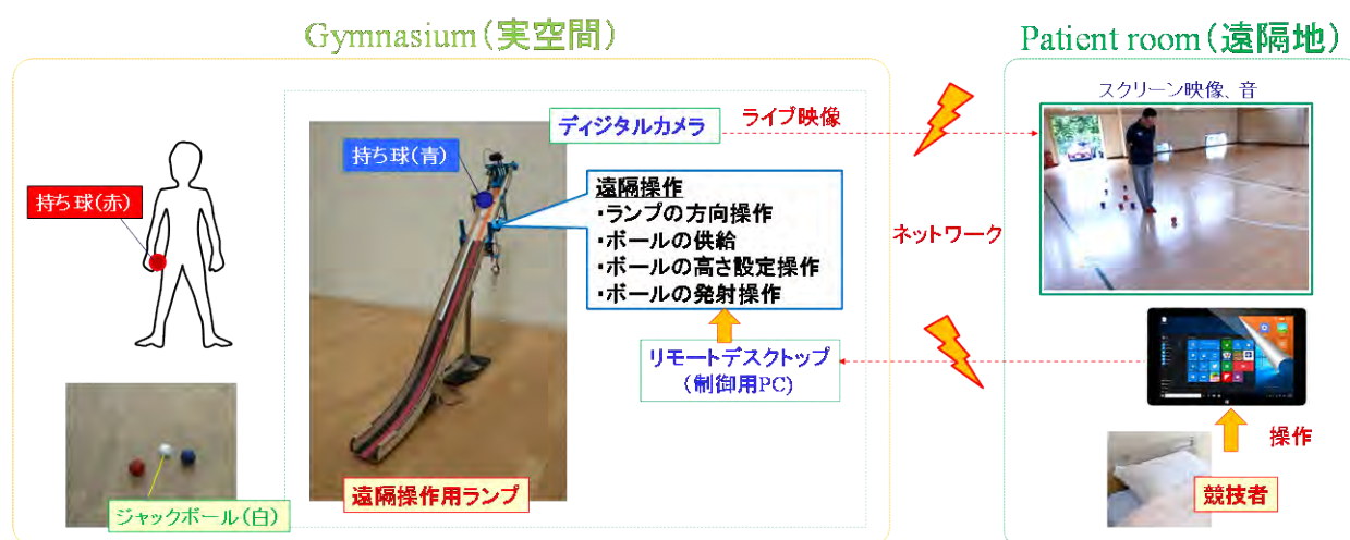
遠隔地から実空間でのボッチャ競技参加システム

コロナ禍の影響で練習ができない状況が続いている。また、ボッチャを行う体育館から自宅までは距離があり、移動が大きな負担であった。そこで、 遠隔地に居ながらにして、ボッチャの競技を行うことが可能 な支援システムの構築を行った。2021年1月27日、SMAの方に操作を行って頂き、遠隔地のご自宅から、太田キャンパスに設置されたランプの操作を行った。SMAの方ご自身による操作で、遠隔地からボッチャの試合を2回行うことができた。次に、重度障がい者の微小な動きを操作に反映させるためのインタフェースの構築を行った。ここでは指先の僅かな動きを小型カメラで捉え、操作のためのインタフェースを想定している（別紙）。