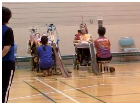
2019年ボッチャ群馬大会の様子