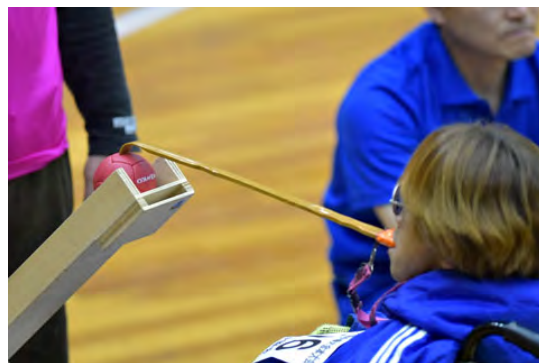
ボッチャのランプとリリーサー

しかしながら、重度障がい者の中にはリリーサーを使えない場合がある。そこで本研究グループでは、群馬県ボッチャ協会の協力のもとで、ボタンによる操作でボールがリリース可能なシステムの構築を行ってきた。