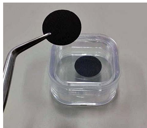
16φディスク状 CROUS ® の外観